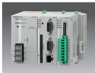
节能数据收集服务器 EcoWebServer II

三菱电机所提供的节能解决方案，通过能源消耗量的可视化，为各种工厂提高生产效率和环境减负做贡献。